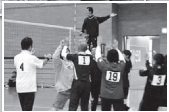
奥州市立江刺第一中学校 PTA