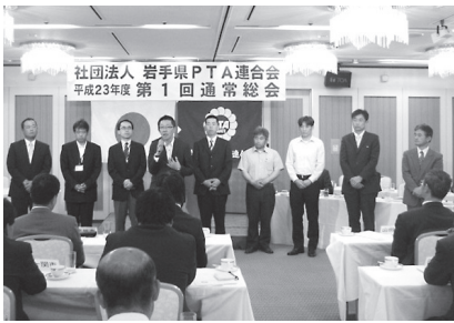
社団法人 岩手県 P T A 連合会 平成23年度 第 1 回 通常総会

平成23年度の第1回通常総会が6月5日(日)13時から盛岡市のホテル・ルイズで開催され、県内34市町村より、本人出席26名、委任状による代理出席0、書面表決書提出8名の出席を得て、平成22年度事業・決算報告や公益認可申請その他の案件審議がなされた。