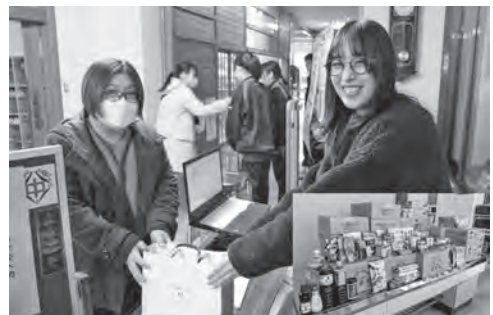
フードバンク 地域・保護者からの寄付

令和4年度に日頃市中、越喜来中、吉浜中と統合し、新生「第一中学校」をスタートさせ、3年目を迎えている。学区が広がったことで、PTA活動の充実化のために、どのように運営していくか、現在でも模索を続けている状況です。今年度は、活動スローガン「共に学び、共に育つために、一人一人が参加するPTA活動の展開」を掲げ、文化教養部、保健体育部、生活指導部で各種取組を行っています。代表的なものとして、生徒会企画の新校舎を60年持たせる取組の一助に年2回6