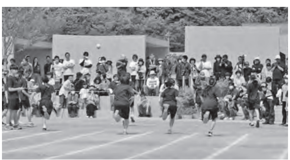
3年ぶりの本校グラウンドでの運動会