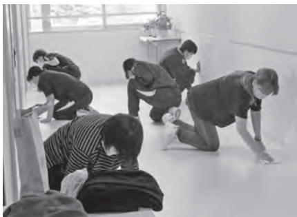
親子環境整備作業

月と10月に行われる親子環境整備作業が挙げられます。それぞれの作業日に学年を割り当て、取り組んでいます。当日は多くの保護者に来ていた