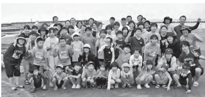
夏まんきつレク サイコー

本校は釜石市の西部に位置し、遠野市と境をなしています。周囲を五葉山や愛染山、箱根山などの山々に囲まれ、学区内を甲子川が流れている自然豊かなところです。