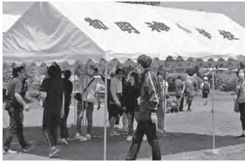
保護者による運動会の片づけ作業

指導してくださったそば打ち講師の方を頼りに準備を進めています。 今後も、地域の方のご協力をいただきながら、保護者と教職員の連携を図り「児童が中心」の活動を進めていきたいと考えています。 (事務局 及川公子)