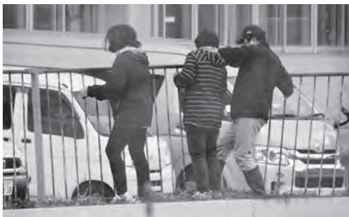
重いプールフェンスの取り付けはなかなかの作業です

本校は奥羽山脈の山間地域に位置し、町全体が標高240m以上の高地にあります。内陸型の気候で、冬季における積雪は2mを超えることもあり、県内有数の豪雪地帯として有名です。そうした地域性もあり、四季の変化に合わせた環境整備を中心とする、