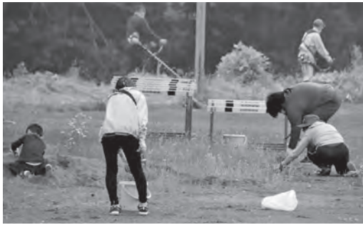
草刈り機と手作業での除草作業です

本校は奥羽山脈の山間地域に位置し、町全体が標高240m以上の高地にあります。内陸型の気候で、冬季における積雪は2mを超えることもあり、県内有数の豪雪地帯として有名です。そうした地域性もあり、四季の変化に合わせた環境整備を中心とする、