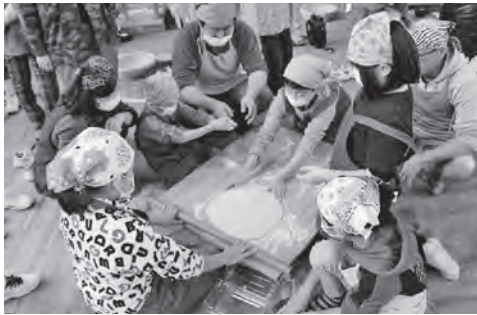
令和元年度のそば打ち体験