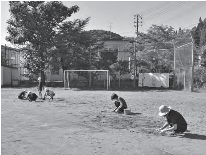
「できる人が、できる時に」を合い言葉に環境整備作業をしました

なった御所野縄文遺跡があり、1・2年生は生活科で、3年生以上は主に総合的な学習の時間に御所野をテーマに