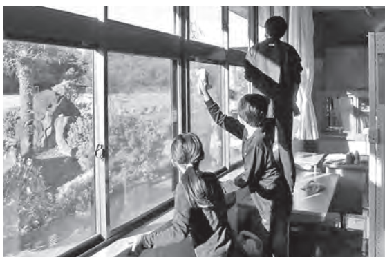
親子で環境整備作業をしました

また、春と秋に行われる「親子環境整備作業」では、児童数の減少に伴い、PTA会員数も年々減少している実態ではありますが、子どもたちのために、大人の力を集結し、一緒に教育環境を整える姿は、子どもたちの目と心に残る姿となっています。翌日ピカピカに光っている校舎内の窓を見上げながら、感謝の心も入り、より一層学習に力が入る子どもたちです。