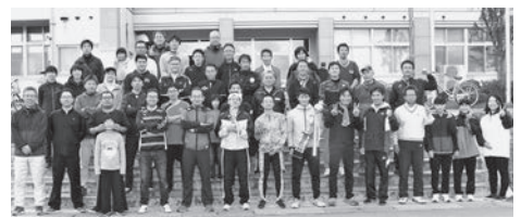
圧倒的な存在感を示す「おやじの会」