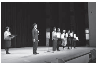
11月の3団体による合同大会の様子です