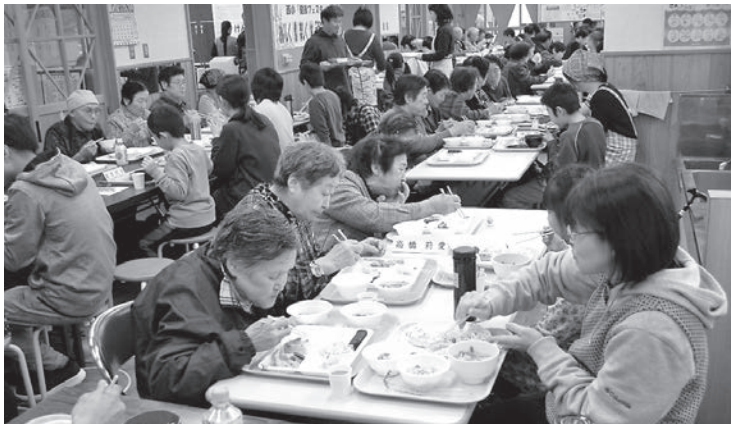
地域の方々と世界の味を楽しみました

平成30年度は、お母さん方が料理を作っている間に、お父さん方と子どもたちはキンボールで運動。その後、地域の高齢者の方々をお迎えし、子どもたち