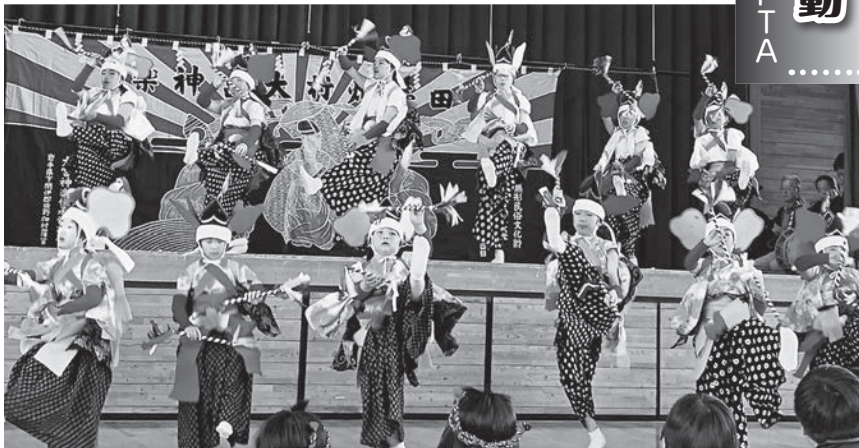
羅賀、平井賀地区の児童による大宮神楽です

今年度は9月に本校体育館で発表会を行いました。子ども達は日頃の練習の成果を発揮し、高学年から体の小さい1年生までが加わって、神楽、鹿踊り、剣舞、太鼓の4種類の芸能を堂々と披露して会場を沸かせました。また、伝統衣装の着付けでもPTAが中心となって助け合っ