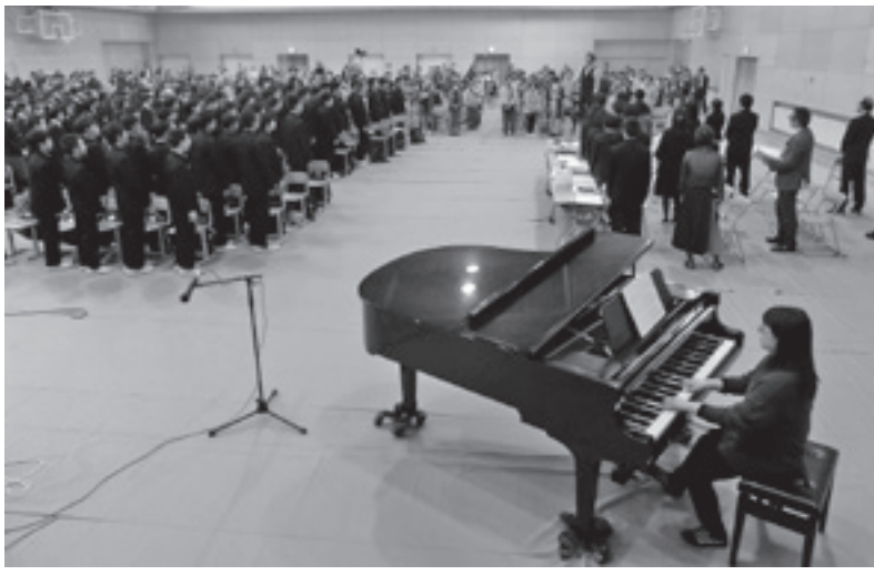
萩香祭：全校生徒とPTAの全体合唱

によるいじめや、児童ポルノ被害、出会い系サイトでのなりすましによる被害の実例が挙げられ全校生徒とともに学習しました。